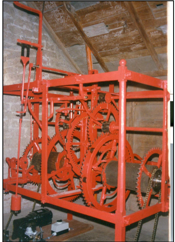
Het in 1996 gerestaureerde uurwerk .